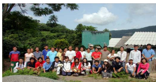
ホイプム村(平成22年9月スタディーツアー)ホイプム村の皆さんとお餅つき