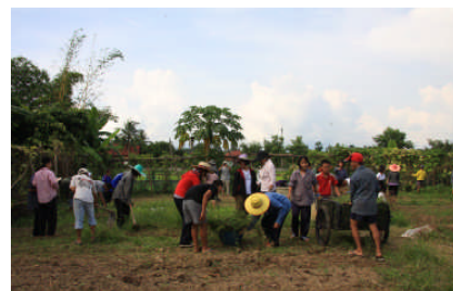
寮生と一緒に農作業(自給自足の畠)