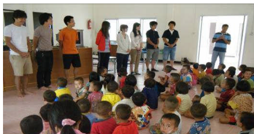
センサイ村幼稚園