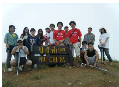
プーチーファー(平成22年9月)