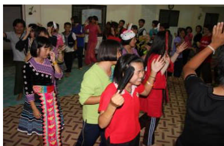
寮生と阿波踊り交流