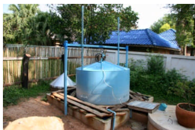
エコトイレからのガス収集システム